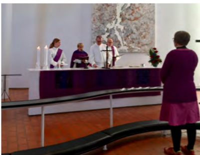
Olarin seurakunnan siunattavana

Seurakuntakodin naapurissa sijaitsevan mielenterveyden toimintakeskuksen aloitteesta myös saunan pihapiiriin ollaan perustamassa vastaavanlaista puutarhaa. Sielläkin haluamme olla mukana ja kasvattaa ainakin kukkia seurakunnan tarpeiksi!