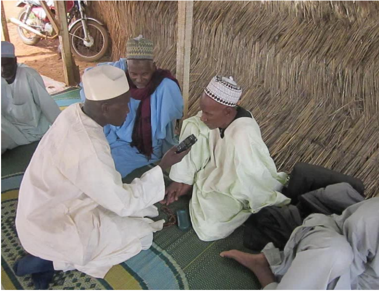
Kuva 3: Sawtu Linjiilan radiotyön arviointi toteutettiin kuulijoiden haastatteluina.

Kamerunissa Sawtu Linjiilan tuottamien, fulfuldenkielisten ohjelmien lyhytaaltolähetykset loppuivat helmikuussa 2020. Lähetysjätkettiin FM-taajuuksilla. Kamerunissa ohjelmia lähetti 15 paikallisasemaa ja Tsadissa kaksi paikallisasemaa. Sansan mediatutkija Eila Murphy arvioi Sawtu Linjiilan työn vuoden 2019 lopussa. Toiminnan todettiin olevan tavoitteiden mukaista, mutta hallinnossa havaittiin ongelmia. Ongelmiin tartuttiin, ohjelmat keskeytettiin ja johtajat ovat vaihtuneet. Työ palautuu normaaliksi vuoden 2022 aikana.