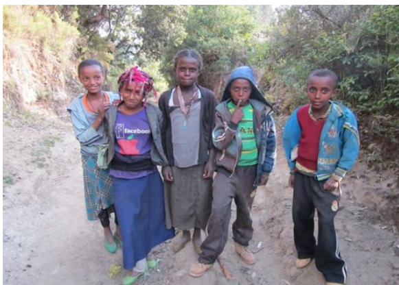
Kuva 2: Etiopiassa koronapandemia on sulkenut koulut ja lasten radio-ohjelman suosio on kasvanut.

Etiopia kärsi maan pohjoisosan sisällissodasta ja koronaviruksen tuomista rajoituksista. Maan talous on heikentynyt, ihmisten elinolosuhteet huonontuneet levottomuuksien ja rahan arvon laskun takia. Tunnelma on ajoittain pelonsekainen. Näissä olosuhteissa mediaosasto jatkoi ohjelmien tuottamista, vaikka töitä täytyi tehdä kotoa käsin.