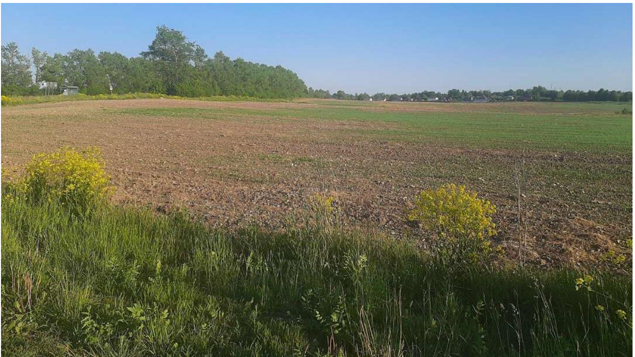
Pahasti kuivunut pelto Tuutarin kirkon lähellä

Eräs seurakuntalainen kertoi, että perunat istutettiin kuukautta aikaisemmin, mutta mitään ei ollut vielä noussut. Kun hinnat ovat nousseet, monen eläke on liian pieni kaiken ruuan ostamiseen kaupasta. Eräs ystävä sanoi, että hän katsoo, missä on millaisiakin tarjouksia ja ostaa vain tarjousruokaa.