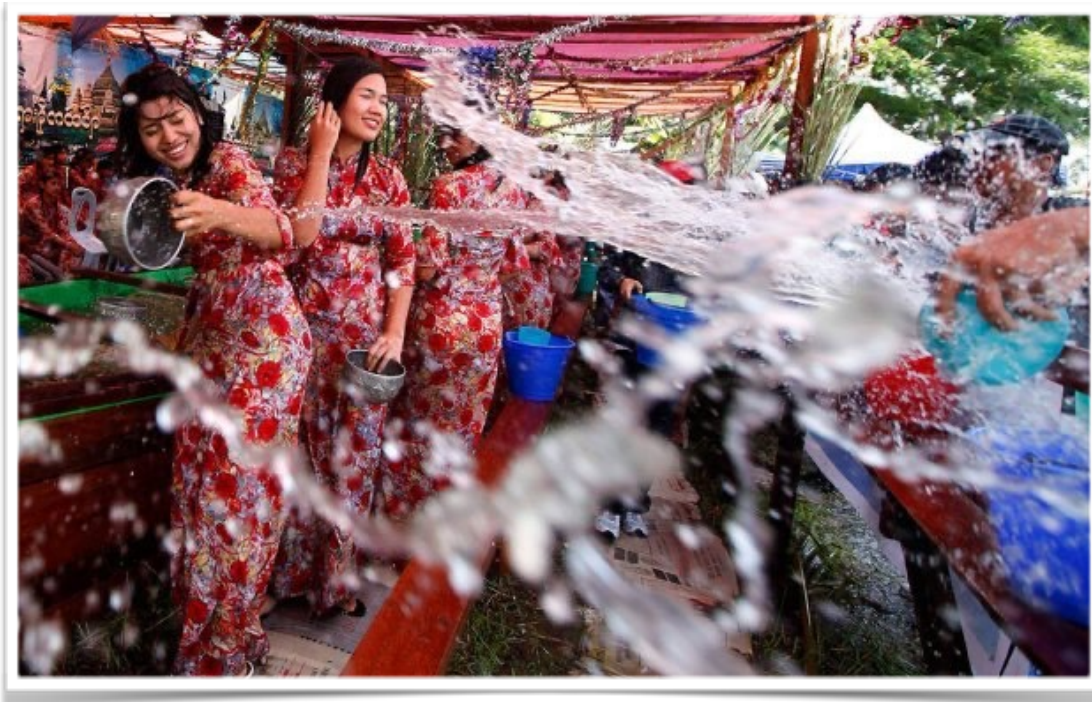
Kuvassa Thingyanin viettoa parhaimmillaan.

Eräs juhlallisuuksien herkku on kuvassa näkyvä ”Mont lat saung”, mikä on Myanmarilainen perinteinen sokerista ja riisihyytelöstä valmistettu juoma, johon sekoitetaan kookosmaitoa ja jota voi festivaalin aikana ostaa joka kadunkulmasta. Ihmiset jakavat kotien edessä perinteisiä ruokia kuten riisijauhusta ja palmusokerista valmistettuja pyöryköitä, jotka paistetaan rasvassa ja sitten jaetaan almuina munkeille ja ohikulkijoille.